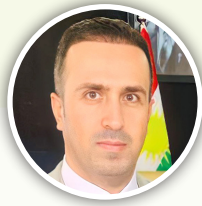
نىچىرفان سەلمان وەيسى